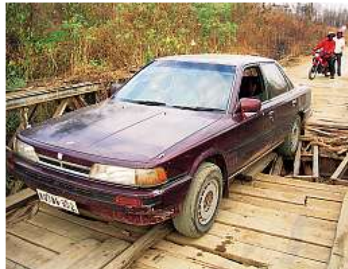
Oben: «Taxi» auf der Strecke von Battambang nach Pailin, Kambodscha. Sicherheitshalber sind die Fahrgäste vorher ausgestiegen.