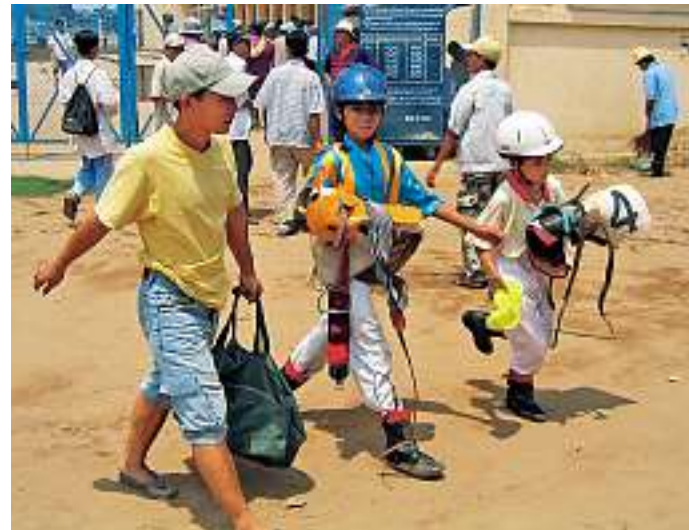
Oben: (Angeblich) 14-jährige Jockeys nach dem Rennen, Saigon, Vietnam Unten: «Crazy House», ein Hotel in Dalat, Vietnam