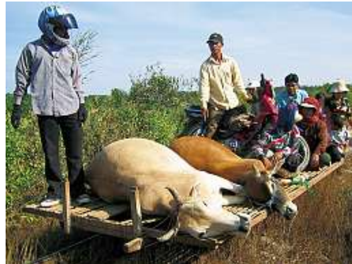
Unten: Auf der Zugstrecke von Battambang nach Phnom Penh, Kambodscha. Eine Frau auf der Suche nach den Läusen ihres Mannes